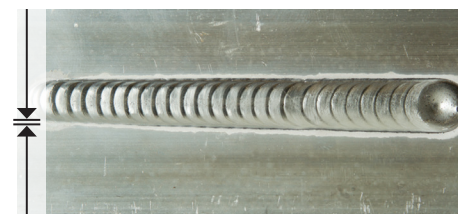
TIG-sveis med Alumix