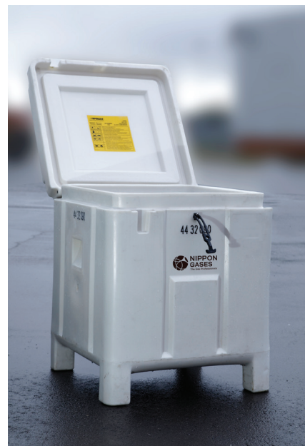
Varenr. 700628 Container HG 100 (90 kg m. skiver, el. 80 kg pellets)