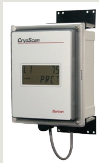
Bild 2, övervakningsenhet.